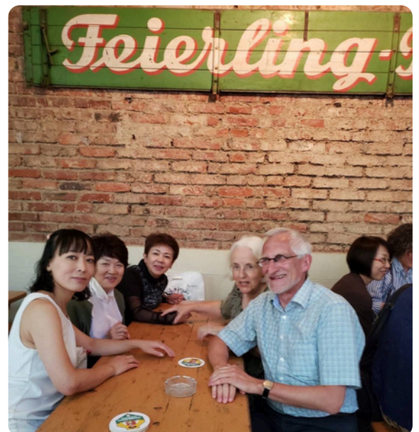
2019年 姉妹都市提携30周年記念 フライブルク訪問時